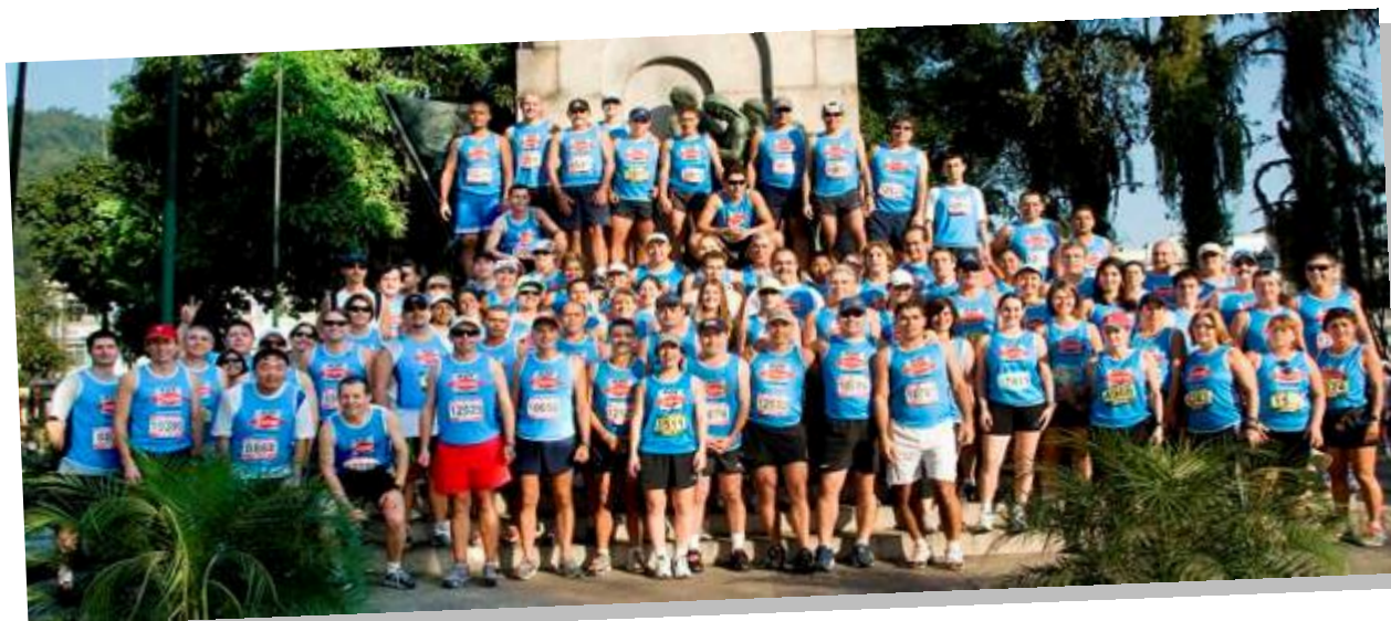
10 km – “A Tribuna”