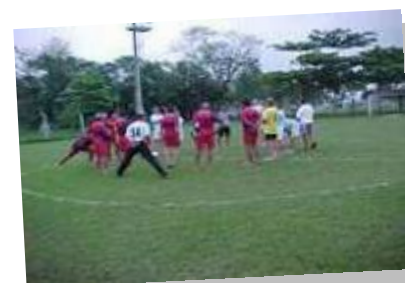
Campo de Futebol